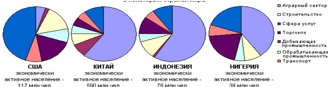
Рисунок 2 - Занятость населения по отраслям хозяйства в некоторых странах мира 2009 г. [5]

В развитых странах доля сельскохозяйственного населения неизмеримо меньше, а доля рабочих, служащих и интеллигенции больше чем в развивающихся странах. Велика также доля населения, занятого в сфере услуг (пассажирский транспорт, розничная торговля, коммунально-бытовые услуги). В Великобритании, Германии, Бельгии, Франции, Швеции в этой сфере работает около 40% экономического населения, в США - более 50% [5]. На рисунке 2 представлена занятость населения по отраслям хозяйства в некоторых странах мира по данным на 2009 г.