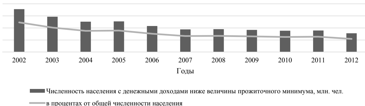
Рисунок 2 – Динамика численности бедных и уровня бедности в России 2002-2012 гг. [12]

По отечественным стандартам уровень бедности зависит от величины прожиточного минимума. Оценивая уровень бедности в России, необходимо учитывать мизерность самого прожиточного минимума, определяющего ее уровень. По сравнению с другими странами он действительно кажется минимальным: в российской корзине всего 156 наименований против, например, 700 в Великобритании, 475 в Германии. В развитых странах прожиточный минимум составляет 60% от средней зарплаты в обществе. По стандартам Западной Европы критерием бедности считается доход, составляющий \frac{2}{3} среднедушевого в стране. Например, французский минимум для определения малоимущих определяется цифрой в 650 евро [2,42]. В США человек, получающий 800-900 долл., имеет право на социальную помощь от государства [6].