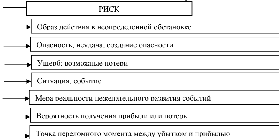
Рисунок 2. Различные подходы к определению риска

потерь, которые могут произойти в результате принятого и реализуемого решения. Риск в данном случае рассматривается как ущерб, который наносится реализацией данного решения. Данное толкование сущности риска носит весьма односторонний характер по рассматриваемым последствиям [10]. На рисунке 2 приведены основные подходы к определению понятия, отражающие основные черты, элементы и свойства риска.