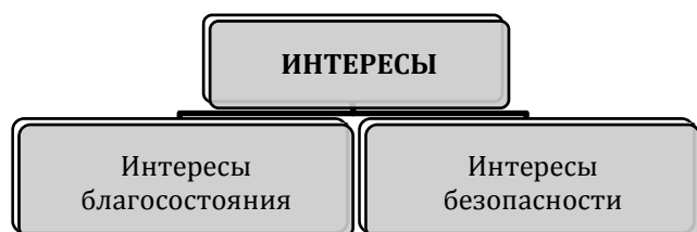
Рисунок 1 – Классификация интересов по функциям жизнедеятельности

Поскольку общественная потребность выступает характеристикой уровня устойчивости социально-экономической системы, а нужда – степе-