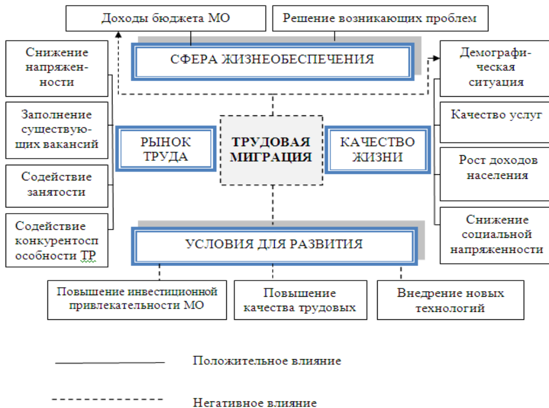
Рисунок 1 - Влияние трудовой миграции на некоторые социально-экономические аспекты развития муниципального образования

В условиях маятниковой и временной (сезонной) трудовой миграции сумма удержанного налога на доходы физических лиц становится источником дохода бюджета не по месту учета налогоплательщика, а по месту его работы. Источником информации о сумме недополученных муниципальным образованием доходов можно судить только по данным налоговых органов и Пенсионного фонда России.